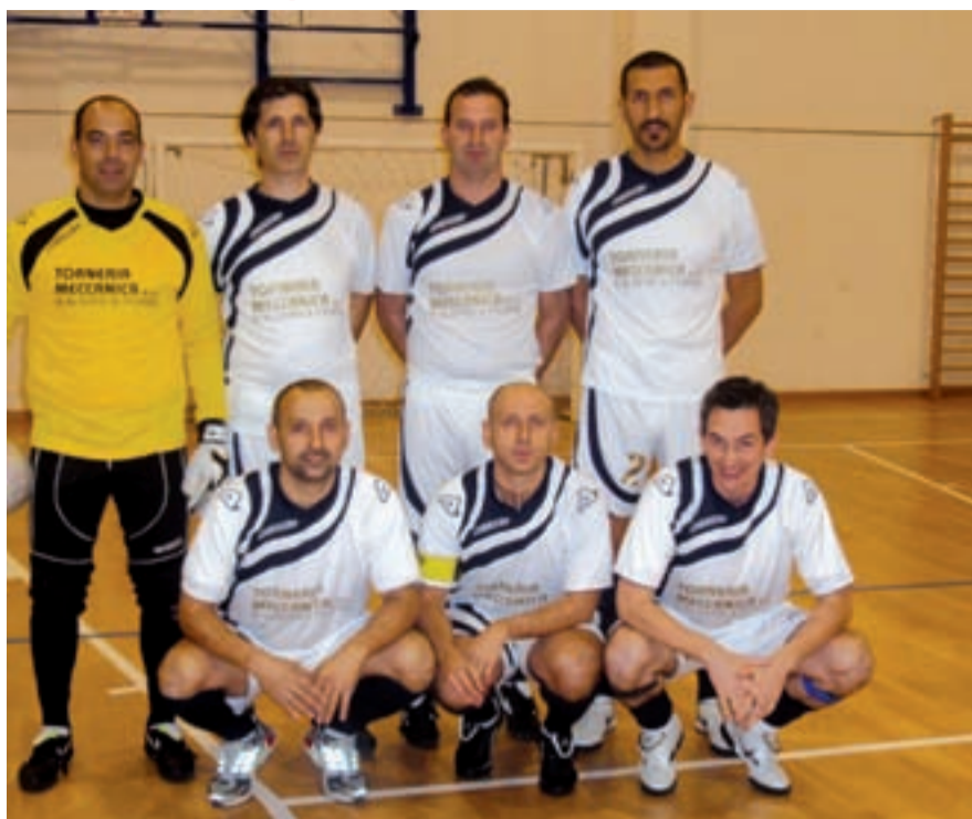
La formazione dell'Erbanno Mat. Edili Rebaioli, terza in classifica

Altra squadra da tenere in forte considerazione è l'Angolo Auditerm, classificata attualmente al quarto posto e con ottime individualità. Dietro a questo gruppetto di squadre, che si stanno giocando il titolo, vi sono altre squadre come il Mazzunno, il Pisogne, il Berzo