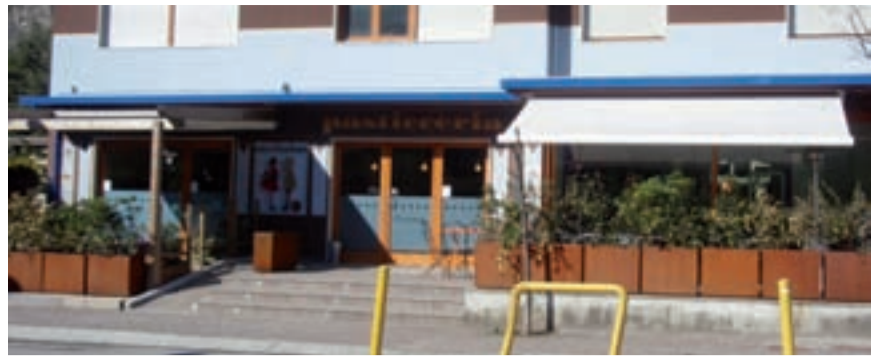
L'ingresso del Sterlin Bar a Piamborno Sotto uno scorcio dell'interno

Il progetto è rivolto ad aspiranti imprenditrici o lavoratrici autonome, imprenditrici, lavoratrici autonome.