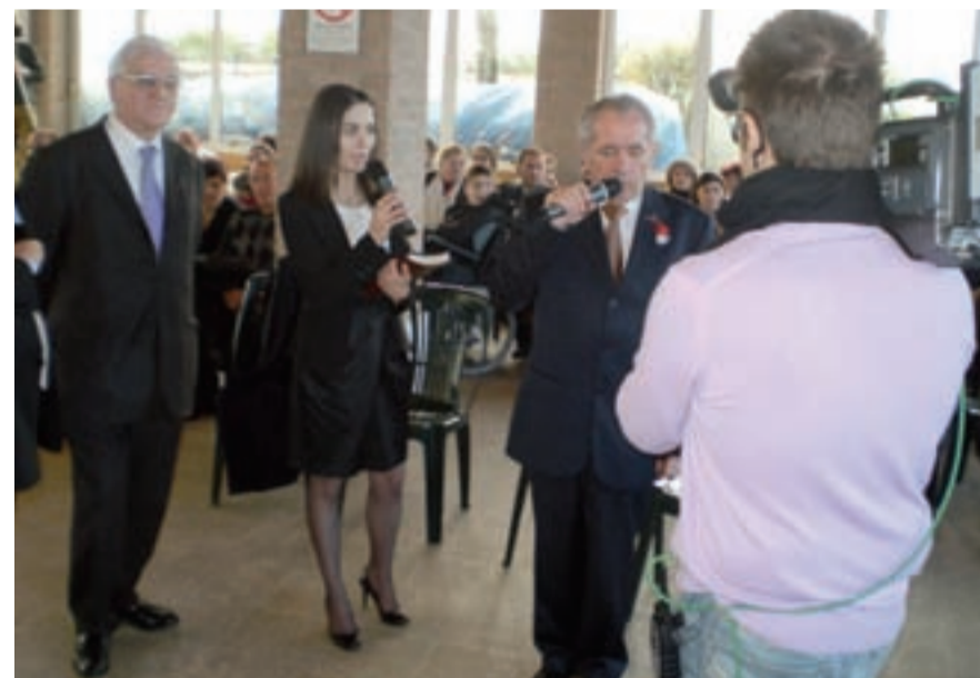
L'Ambasciatore Moldavo in Italia dott. Gheorghe Rusnac saluta i presenti (Sotto) una parte del pubblico intervenuto