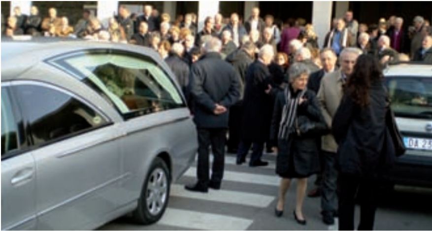
L'uscita dalla chiesa di Boario del feretro salutato da una gran folla commossa