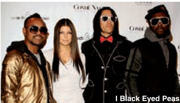
I Black Eyed Peas

In occasione della sua 10miliardesima vendita, lo scorso 24 febbraio, iTunes rivela al pubblico la classifica delle 10 canzoni più scaricate, e quindi vendute, "di tutti i tempi".