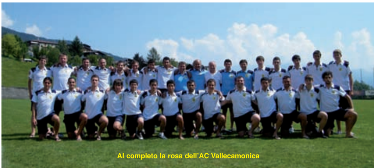
Al completo la rosa dell'AC Vallecamonica

Periodo nero per l'AC Vallecamonica che è incappato in una serie di risultati negativi, fortunatamente gli ottimi risultati ottenuti nel corso del campionato consentono agli uomini del misterer Fiorenzo Giorgi di mantenere con un buon margine di vantaggio sulle squadre inseguatrici il primato in classifica.