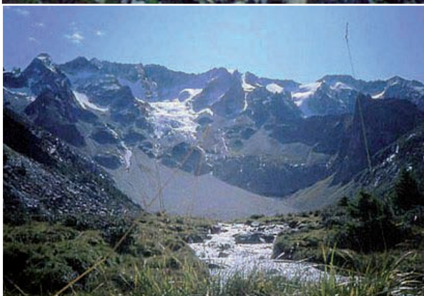
(In alto): Il ghiacciaio dell'Aviolo. (sotto) Una bella veduta della Piana del suolo. (a sx) Cappella Venerocollo